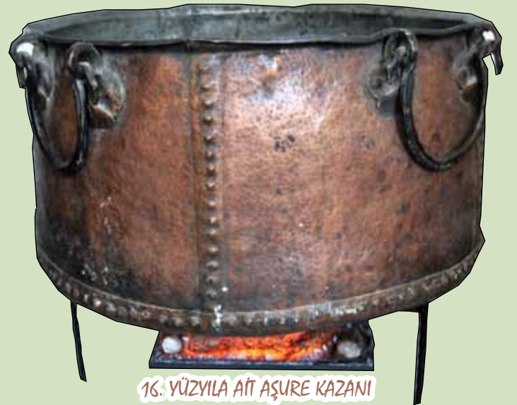
16. YÜZYILA AİT AŞÛRE KAZANI

İçindekiler: Su – Süt – Toz Şeker – Pirinç – Fasulye – Nohut – Göce – İncir – Fıstık İçi – Fındık İçi – Kayısı – Ceviz – Vanilya – Nişasta – Tarçın – Hindistan Cevizi – Çörek Otu – Dut Kurusu – Karanfil – Susam – Haşhaş – Kuş Üzüümü – Zencefil – Portakal Özü- Gül Suyu – Kuru Üzüm- Portakal Kabuğu – Limon Kabuğu – Elma – Nar – Ayva – Greyfurt – Kestane – Kuru Erik – Hurma – Çam Fıstığı – Mısır – Böğürtlen – Defna Yaprağı - Fesleğen