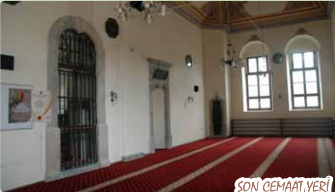
SON CEMAAT YERİ

Mukâbele başlamadan önce semâhaneye postnişinin ve semazenlerin postları serilir. Postnişinin kırmızı postu ( post makamı ) nutrıb heyetinin ( musıkî heyeti ) tam karşısındadır. Şeyh postu en büyük makamdır. Bu makam Hz. Mevlâna’yı