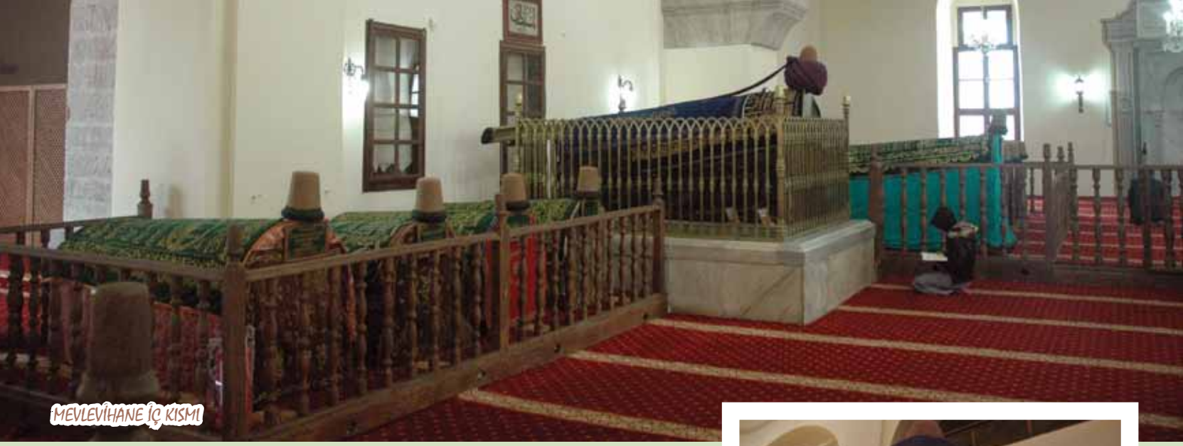
MEVLEVİHANE İÇ KISMI