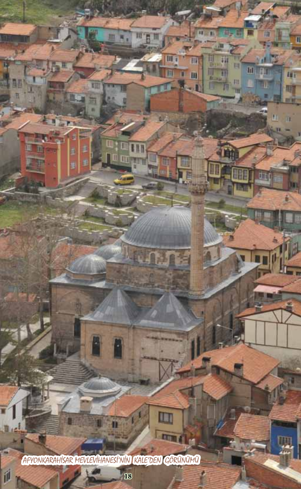
AFYONKARAHİSAR MEVLEVİHANESİ'NİN KALE'DEN GÖRÜNÜMÜ

torasyona alınan Mevlâhânenin “ Derviş Hücreleri/Odaları ” bölümü, Afyonkarahisar Belediyesi Kent Konseyi Kadınlar Meclisinin öncülüğünde tefriş edilmiş, Afyonkarahisar Belediyesi’nin tahsis etmesi sonucu, “ Sultan Dîvânî Mevlâhâne Müzesi ” olarak 30 Aralık 2008 ‘de hizmete sunulmuştur.