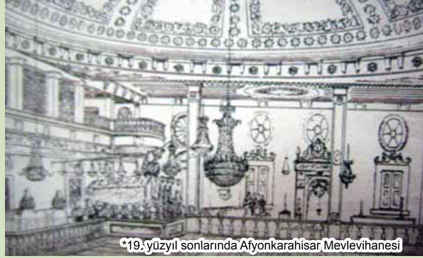
*19. yüzyıl sonlarında Afyonkarahisar Mevlevîhânesi

Mevlevîliğe göre tasavvufî eğitimin amacı, insanın kendine gelmesini, kendini bulmasını sağlamaktır. Gâye aşk-ı ilâhîdir. Hz. Mevlâna, insanların sûretiyle ( dış görünüşü ile ) değil, sûretiyle ( yaşantı biçimi, hâl ve tavırlarıyla ) ilgilenmiş, rûhen olgunlaşmayı ve ahlâken yücelmeyi hedef almıştır. Edeb , her zaman ve zeminde bütün prensiblerin ana eksenini olmuştur.