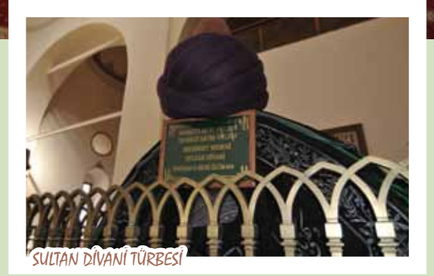
SULTAN DİVÂNİ TÜRBESİ