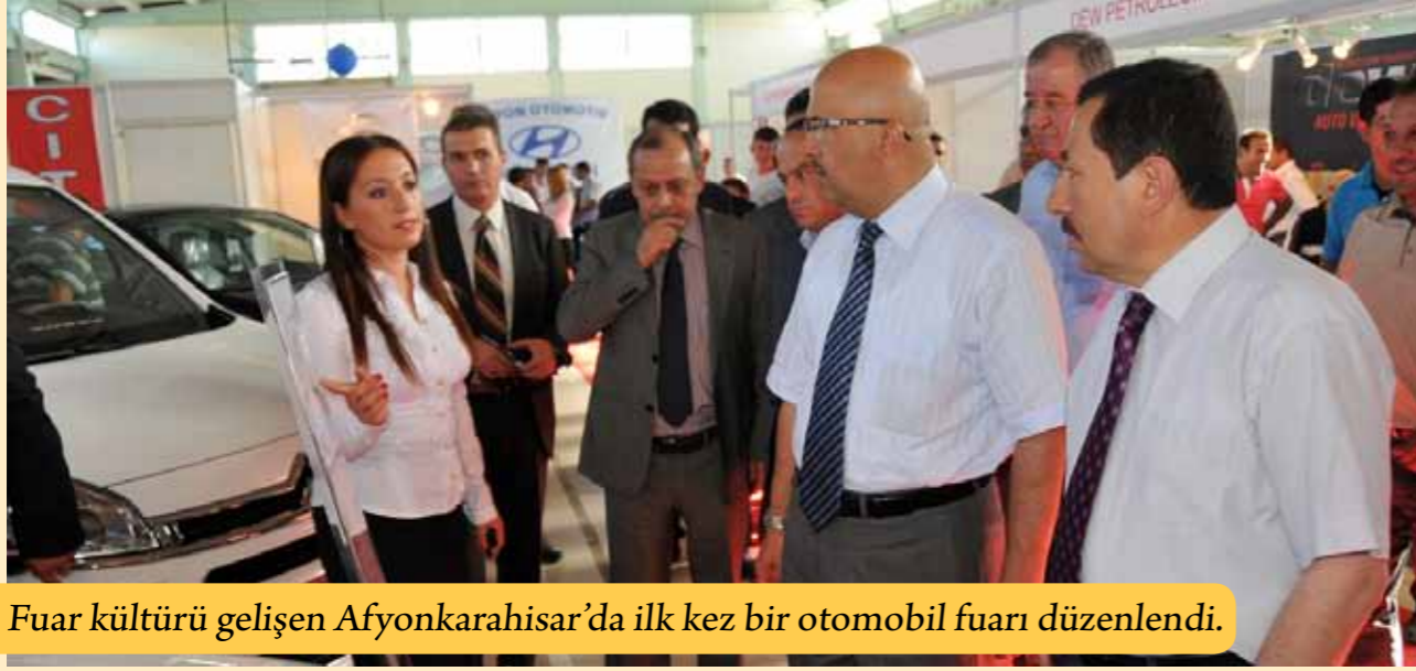
Fuar kültürü gelişen Afyonkarahisar'da ilk kez bir otomobil fuarı düzenlendi.