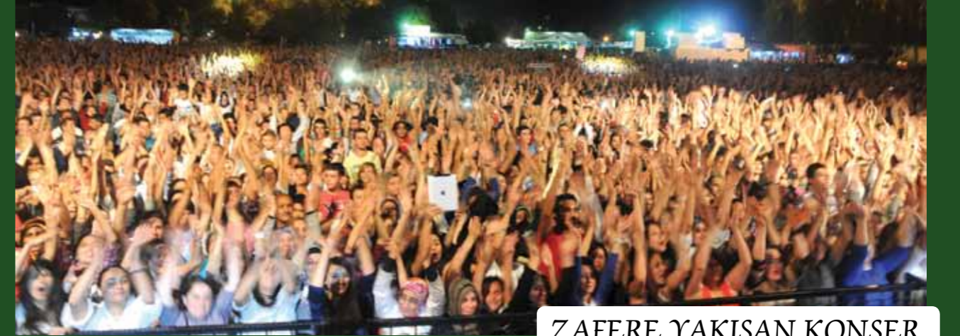
ZAFERE YAKIŞAN KONSER

27 Ağustos 2012 günü yapılan kutlamalar sonrasında Kahraman Şehitlerimizin ruhlarına ithafen çok sayıda vatandaşımızın katılımı ile İmaret Camii'nde ikinci namazına müteakip Mevlid-i Şerif okundu.