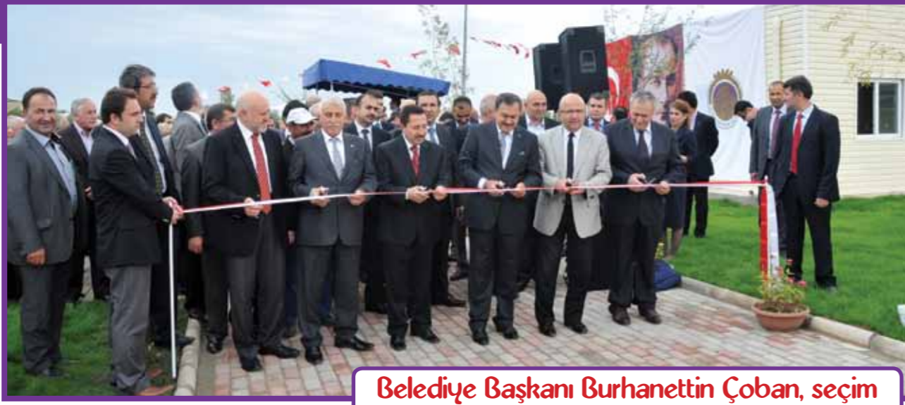
Belediye Başkanı Burhanettin Çoban, seçim öncesi vaatlerinden birini daha gerçekleştirdi.