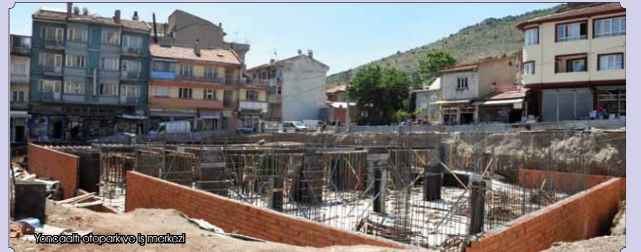
Yoncaaltı Otopark ve İş merkezi