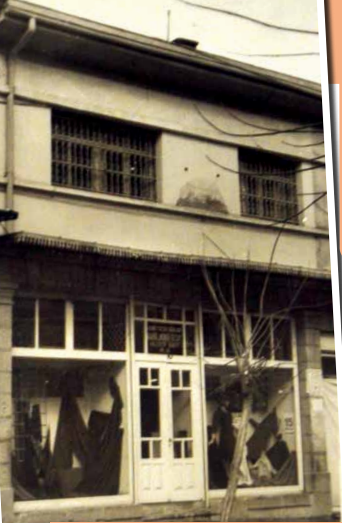
Bugünkü Kuveyt Türk Afyonkarahisar Şubesi'nin bulunduğu binada yıllarca hazır giyim alanında Afyonkarahisarlı'lara hizmet veren Hacı Hakkıların mağazası