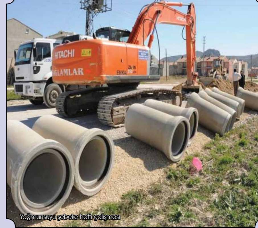
Yağmur suyu şebeke hattı çalışması

Akarçay Rekreatyon Projesi için ihaleye çıktıklarını hatırlatan Başkan Burhanettin Çoban rekreatyon projesi hakkında şunları söyledi: “12 milyon lira harcayacağımız projede, 4 tane çocuk oyun alanı, 4 tane spor mekânı, 2 tane mini basket sahası, 2 tane süs havuzu, mini golf sahası, satranç